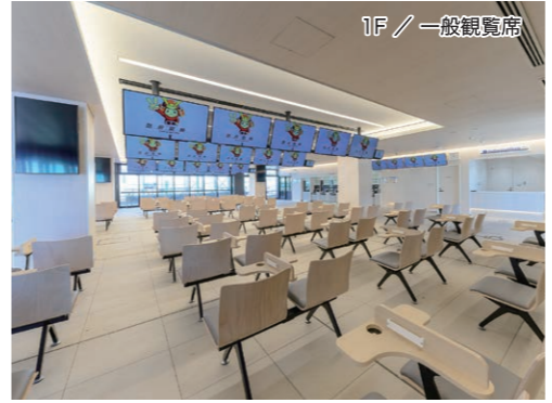
1F / 一般観覧席