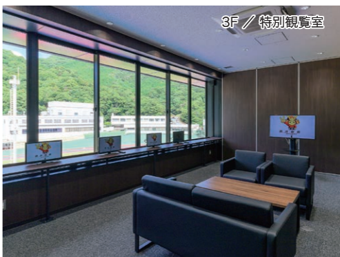
3F / 特別観覧室