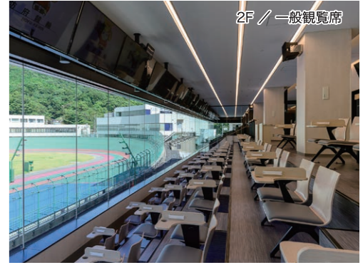
2F / 一般観覧席