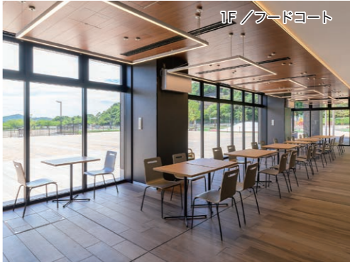
1F / フードコート