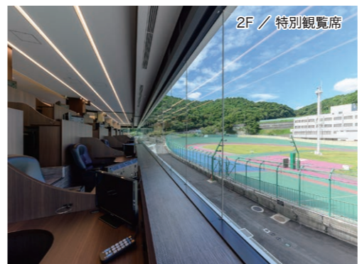
2F / 特別観覧席