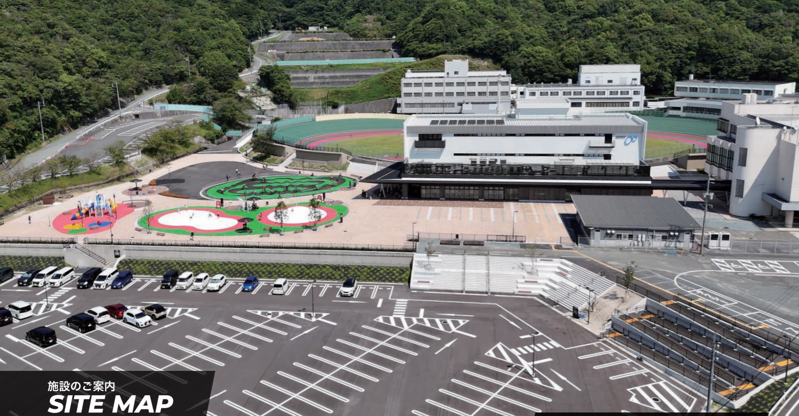
施設のご案内 SITE MAP